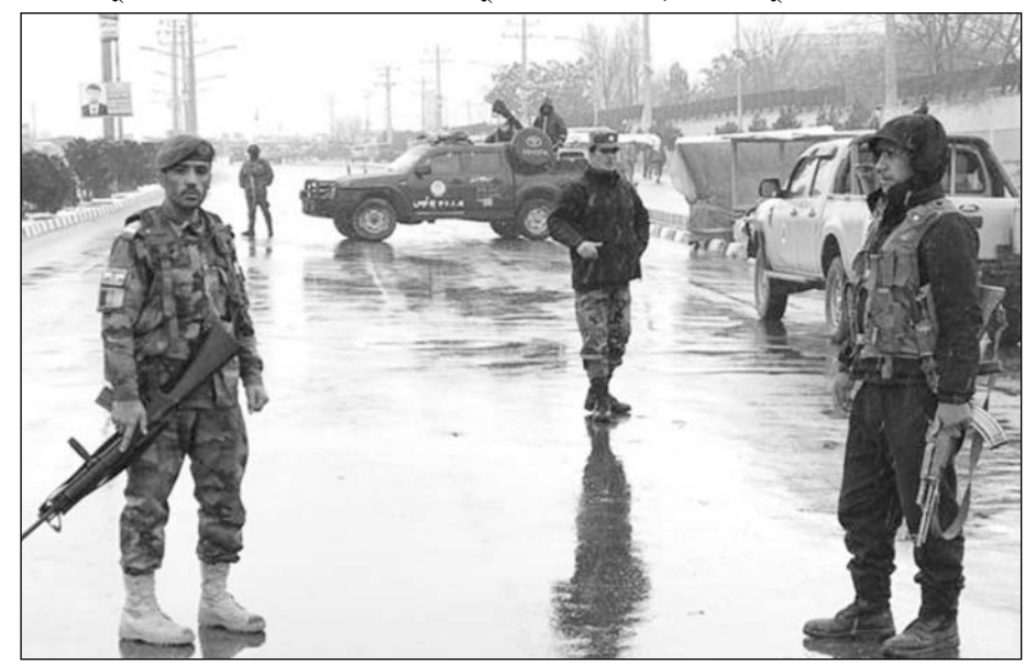
কাবুলের সেনা আকাদেমিতে জঙ্গি হামলার পর সেনাবাহিনীর তৎপরতা